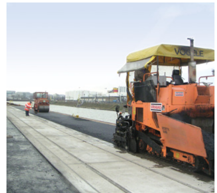
Traggerüstebau und Verdichtung (max. 4 t ohne Vibration!)

Der geringe Wasser/Feststoff-Wert und die abgestimmte Kornverteilung der Einzelkomponenten des Dyckerhoff MICROFOND ermöglichen die Herstellung eines Mörtels mit extrem dichtem Gefüge, der bereits nach einem Tag sehr hohe Druckfestigkeiten erreicht.