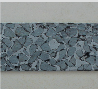
Schnitt durch verfülltes Traggerüst

Die Werte von Dyckerhoff MICROFOND erfüllen alle Anforderungen des „Merkblatts für die Herstellung von Halbstarren Deckschichten“. Dort gibt die Forschungsgesellschaft für Straßen- und Verkehrswesen auf der Grundlage der derzeit vorliegenden Erfahrungen, Hinweise und Empfehlungen für die Planung und Ausführung von halbstarren Befestigungen auf Verkehrs- und Lagerflächen.